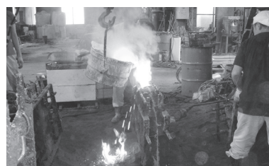
溶けた金属を铸造に流し込む工程

既に 300 人程度の観光客が訪れており、順調に産業観光客の誘致数が推移している。また、組合内においても取組みへの理解が深まったことで受入企業も 12 社に増加し、期待が高まり始めている。組合員においても自社の魅力を発信できる機会の増加に加え、従業員の意識も引き締まりモチベーションの向上にもつながっている効果も出ている。