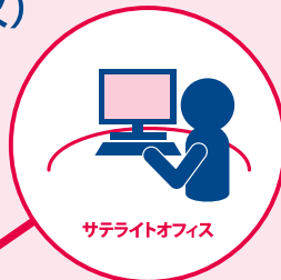
サテライトオフィス